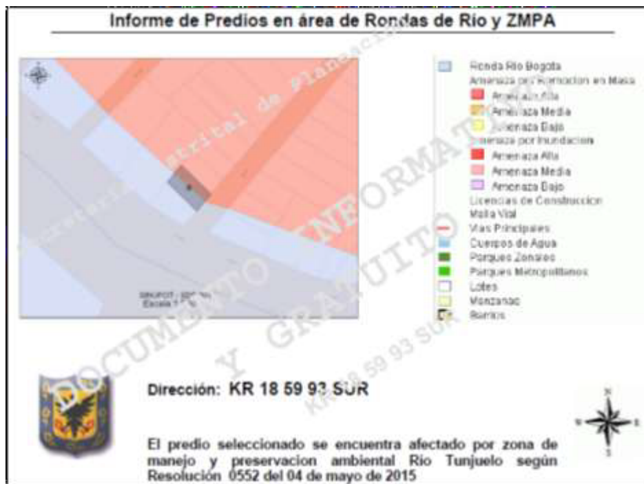
Imagen 1. Ubicación del establecimiento con dirección CARRERA 18 N° 59 – 93 SUR, en donde se verifica que el predio está parcialmente afectado por el Corredor Ecológico de Ronda del Río Tunjuelo.

a. En la ronda hidráulica: forestal protector y obras de manejo hidráulico y sanitario.