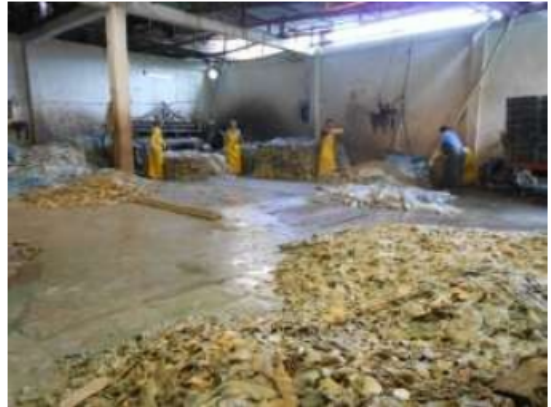
Fotografía 1 y 2. Actividades predios Cr 18 59 93 Sur y Cr 18 59 89 Sur, donde se aprecia que los predios se encuentra unidos en su interior, así como el escurrimiento de residuos líquidos de las pieles sulfuradas.

Dada suspensión provisional del Decreto 364 del 2013 del MEPOT por el Auto CE 624 del 2014, se retoman el Decreto Distrital 190 de 2004, (por el cual se modifican excepcionalmente las normas urbanísticas del Plan de Ordenamiento Territorial de Bogotá D. C.) se define el concepto de Zona Ronda Hidráulica y Zona de Manejo y Preservación Ambiental – ZMPA de un río o quebrada y se establece el régimen de usos de suelo.