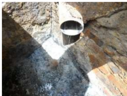
Fotografía 3. Caja de inspección externa predio de la Cr 18 No. 59 – 93 Sur (dirección nueva).